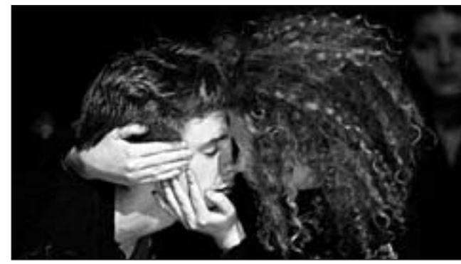
INGELADEN: Die junge „Romeo und Julia“-Produktion aus Hannover.

des Berliner Theatertreffens. In Hannover ist „Heimat im Kopf“ wieder am 13. April um 19.00 Uhr im Ballhof zwei zu sehen. Das Theaterfest zum Wettbewerb „Liebe Macht Tot(d)“ findet vom 17. bis 22. Mai in Berlin statt. Alle fünf Preisträger-Inszenierungen werden dort vor Publikum aufgeführt und vom ZDF aufgezeichnet, um im ZDFtheaterkanal ausgestrahlt zu werden. „Romeo und Julia“ ist wieder am 22., 23. und 29. März und am 12. Mai im Ballhof eins zu sehen.