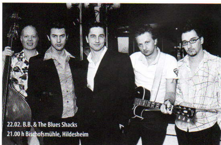
22.02. B.B. & The Blues Shacks 21.00 h Bischofsmühle, Hildesheim

21.00 h , KulturFabrik Löseke, Hildesheim: Mikroboy. www.kufa.de